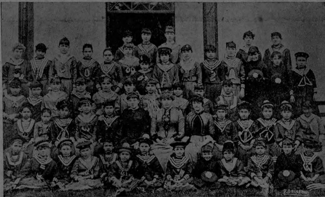
Alumnas del Colegio de Señoritas de 1887.